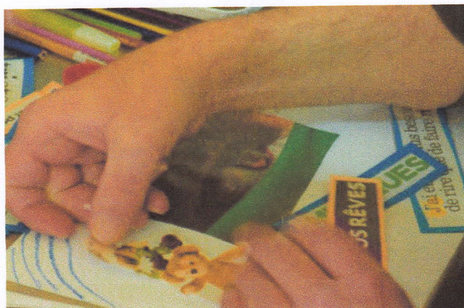
Mains en création

(Cadavre exquis, texte collectif, juin 2011)