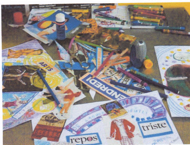
Table en création

« Je serais si heureuse si seulement je pouvais arrêter le temps » Une participante