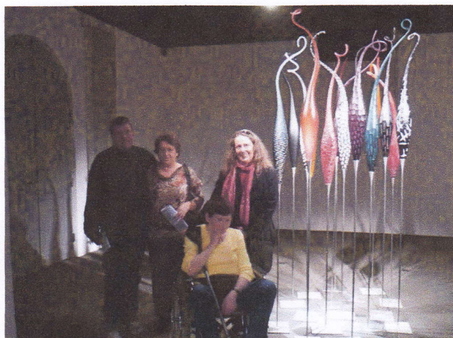
Des membres de notre Association lors de la visite de l'exposition "Au-Delà du Verre" au Musée de l'Ariana organisée en décembre 2011

L'Association « Un Brin Créatif » compte une douzaine de membres et déjà 2 accompagnatrices bénévoles.