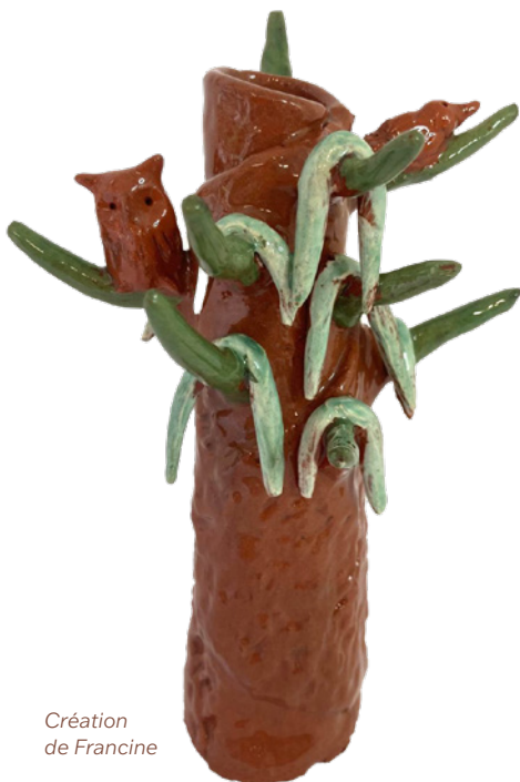
Création de Francine

leurs œuvres, nous sommes capables de les reconnaître. Ils ont leur propre style et c'est très agréable de voir leur évolution artistique tout en gardant leur « patte » artistique. • CB