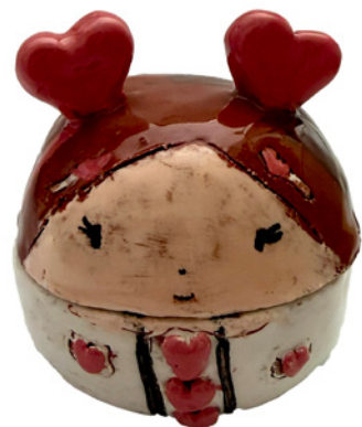
Création de Gladys