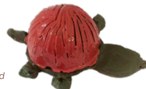
Création de Bernard